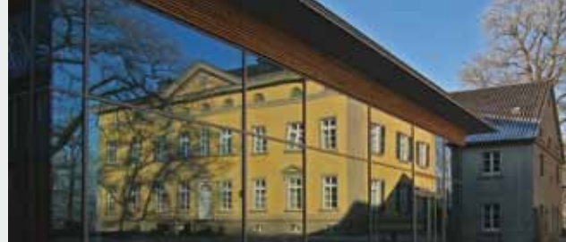
Evangelische Kirche von Westfalen