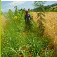
Kleinbäuerliche Initiativen zum Schutz der Umwelt, wie z. B. reduzierter Pestizideinsatz, verringern die Produktionskosten und den Wasserverbrauch, während sich Ernteerträge und Bodenqualität verbesserten.

Die Landwirtschaft ist bis heute die wichtigste Erwerbsquelle und der größte Wirtschaftszweig der Welt. 90 % der 525 Mio. landwirtschaftlichen Betriebe weltweit sind kleinbäuerliche Betriebe (< 2 ha) und Existenzgrundlage für 86 % der ländlichen Bevölkerung. Sie tragen substantiell zur Nahrungsmittelproduktion bei: Kleinbäuerliche Betriebe produzieren 80 % der Nahrungsmittel in den Ländern des Südens (in Afrika sogar 90 %). Sie ernähren 65 % der Weltbevölkerung. 18 Kleinbäuerliche Initiativen zum Schutz der Umwelt, wie z. B. reduzierter Pestizideinsatz, verringern die Produktionskosten und den Wasserverbrauch, während sich Ernteerträge und Bodenqualität verbesserten. Die Produktivität pro Fläche und Energieeffizienz ist bei kleinen und diversifizierten Bauernhöfen viel höher als bei Systemen, die vor allem externe Inputs (fossile Energie, chemischer Dünger, HochleistungsSaatgut) nutzen. Als neues Paradigma der Landwirtschaft des 21. Jahrhunderts formuliert der Weltagrarbericht: „Kleinbäuerliche, arbeitsintensivere und die auf Vielfalt ausgerichteten Strukturen sind die Garanten einer sozialwirtschaftlich und ökologisch nachhaltigen Lebensmittelversorgung durch widerstandsfähige Anbau und Verteilungssysteme. Gerade deshalb sind Investitionen in die kleinbäuerliche Produktion das dringendste, sicherste und vielversprechendste Mittel, um Hunger und Fehlernährung zu