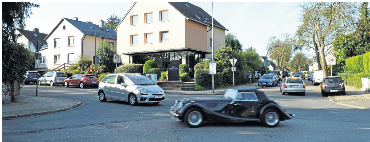
Die Kreuzung Eppendorfer Straße, In der Mark und Im Kattenhagen wird ein Knotenpunkt, wenn im nächsten Jahr der Kanal in Wattenscheid erneuert wird.

Im Zuge der Planung wird bis zum Anschluss an die Holzstraße der vorhandene Kanal vergrößert und ein parallel verlaufender Regenwasser-Kanal bis zum Anschluss an den Graben gebaut. Die Maßnahme wird dazu in zwei Bauabschnitte geteilt.